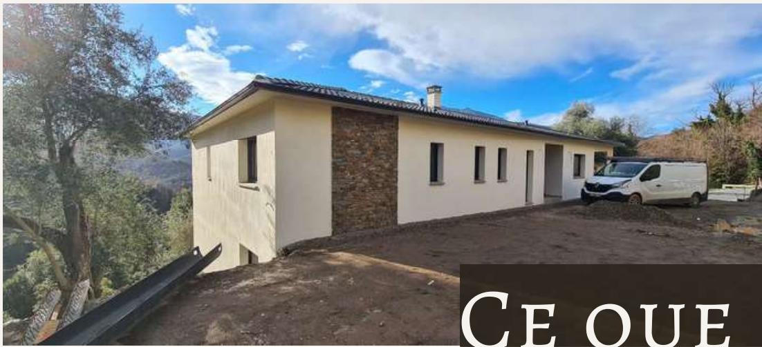
Réalisation d'une villa individuelle à Piazzole