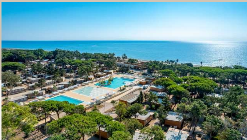
Chantier SANDAYA, Camp de vacances CAPSUD à Venzolasca

Le Groupe DON-JO a été créé en février 2016 par LABATE Giovanni. Il est composé d'un ensemble de sociétés tous corps d'état. Le siège social est basé à Bastia (Haute-Corse), son secteur d'activité lui permet d'intervenir sur l'ensemble de la Corse.